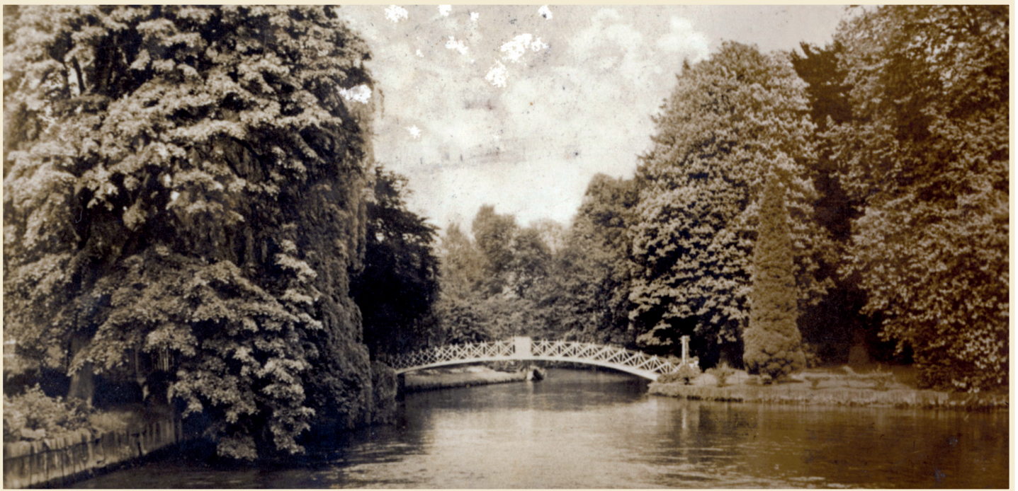
Erckenspark mit Brücke über die Erft 1942

Da man sich im Laufe der Zeit regelmäßig den erforderlichen, technischen Fortschritten anpasste, blieb die Erckens & Co., Baumwollspinnerei und Weberei über viele Jahre hinweg erfolgreich. Der Erste Weltkrieg und die durch diesen erzwungene Rohstoffabgabe führten vorübergehend zu einer vollständigen Stilllegung der Produktion. Dank Papiergarnfabrikation zwischen 1917-1919 konnte man sich dann gerade so über Wasser halten. Als man wieder in geringen Mengen Baumwolle importieren konnte, konnte man den eigentlichen Betrieb langsam wieder aufnehmen.