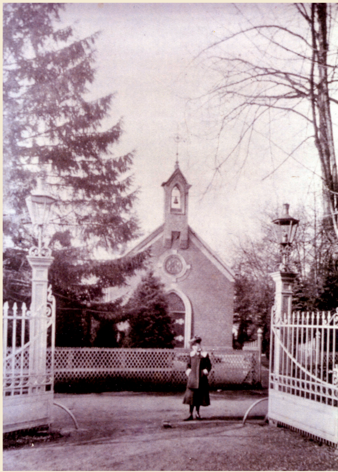
Aufnahme der Kapelle nahe der Villa Erckens um 1920