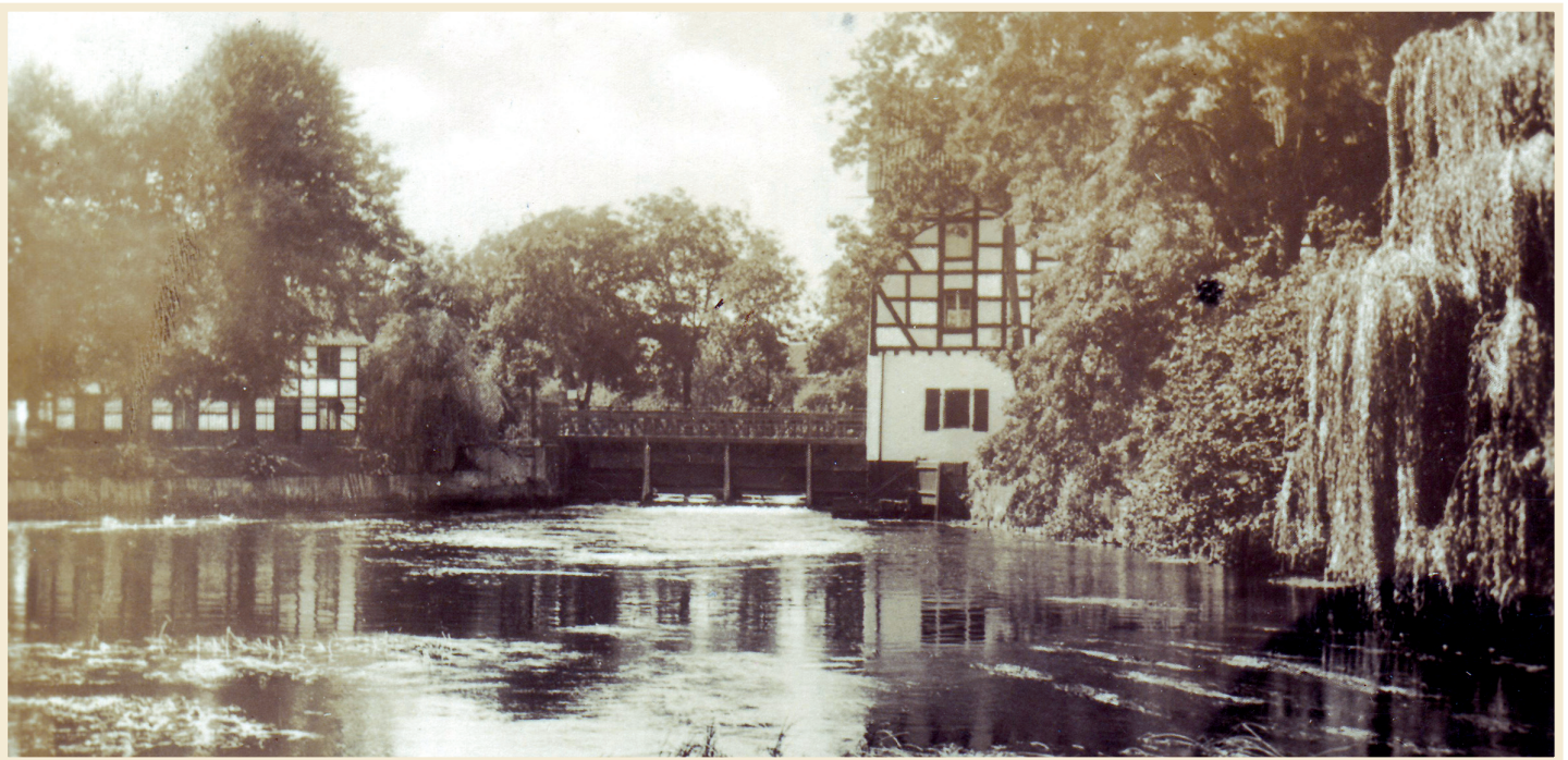
Postkarte „Partie an der Villa Erckens“ aus Sicht der Villa um 1938