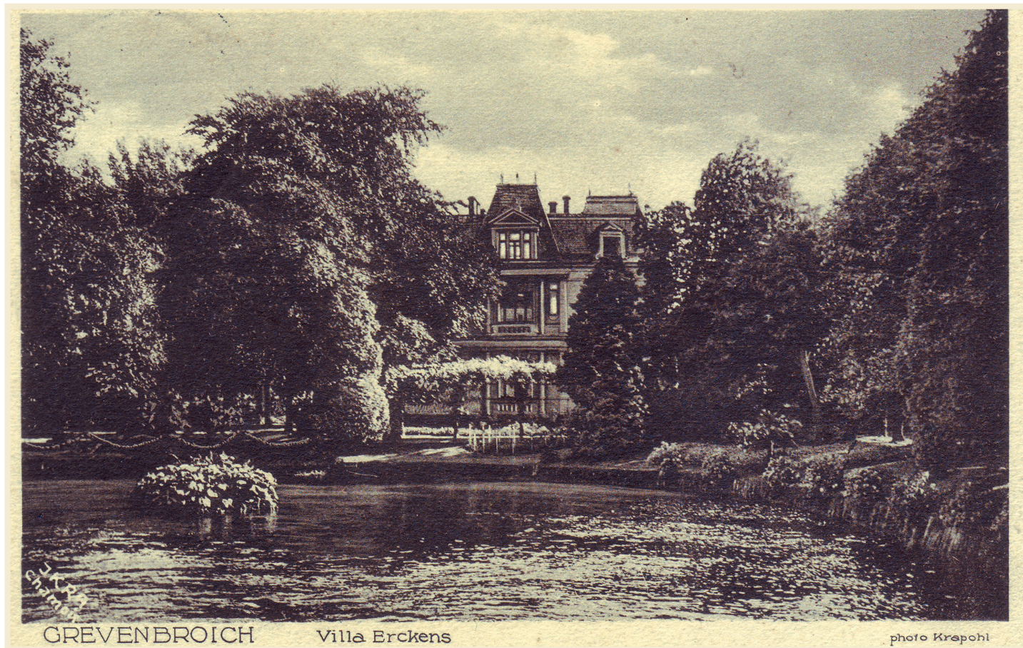
Postkarte „Villa Erckens“ um 1928 © Manfred Ganschietz