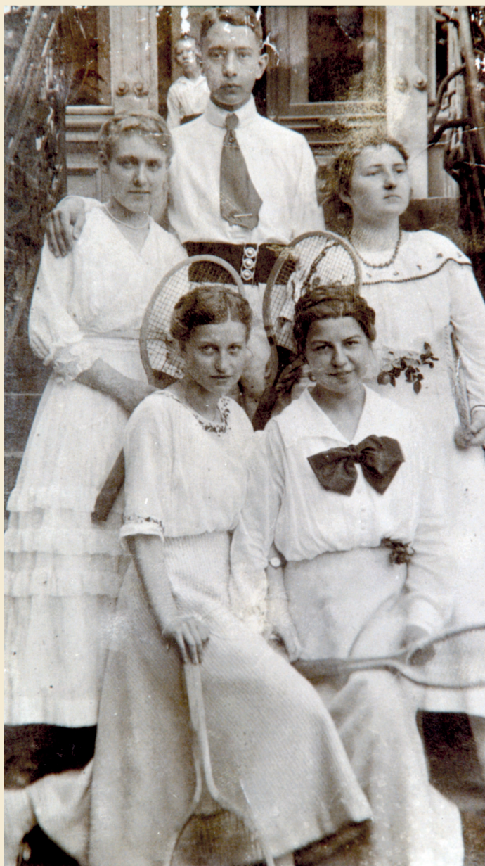
Auf der Villa Erckens Terrasse um 1910