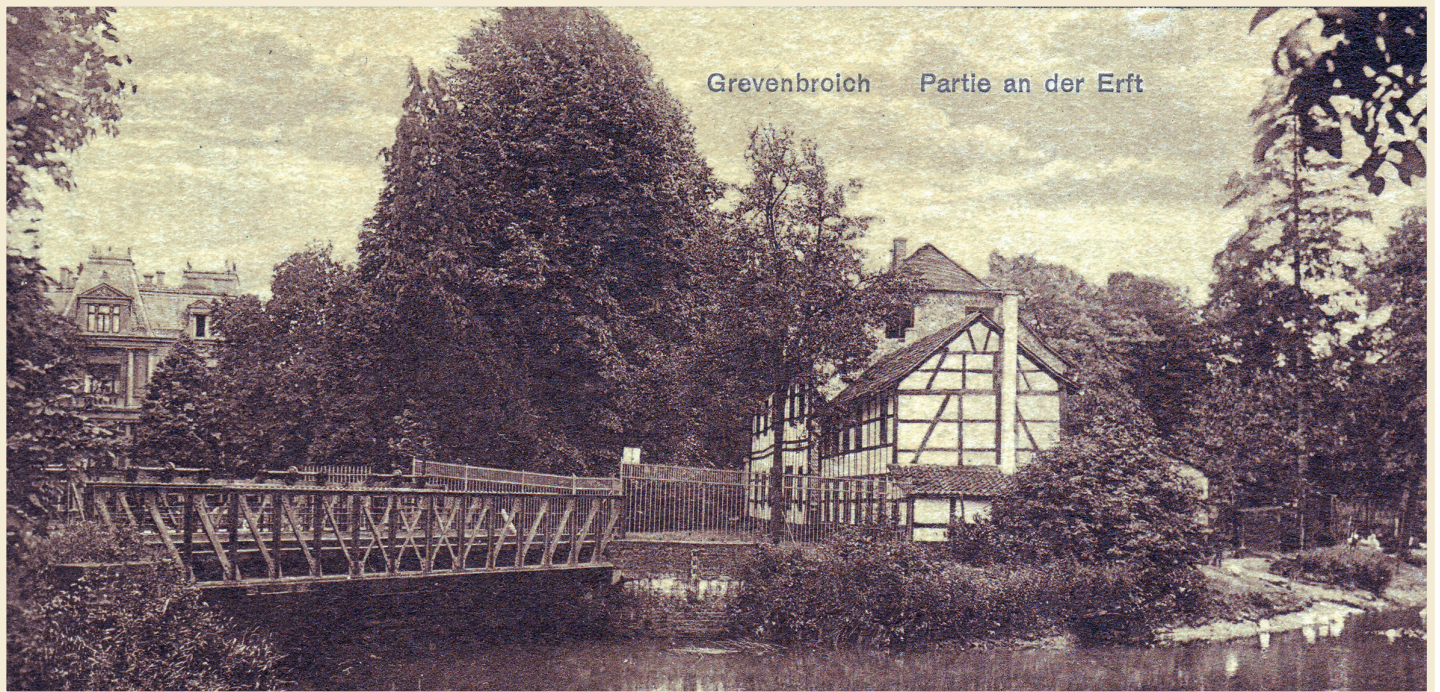
Postkarte „Partie an der Erft“ um 1928