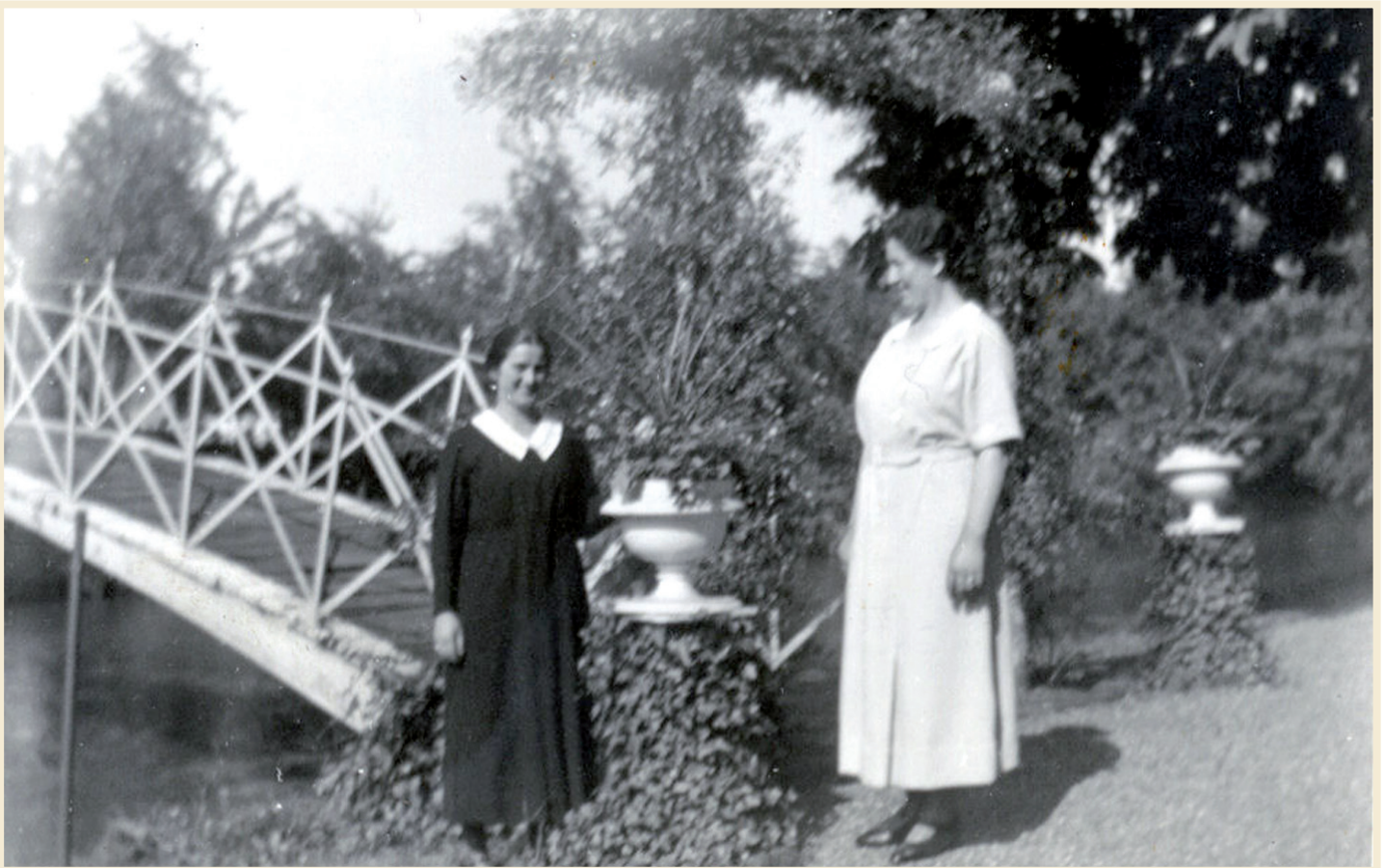
Park Erckens